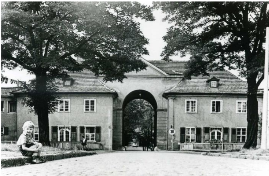
Ostmarkstraße in der Siedlung Paulinenhof