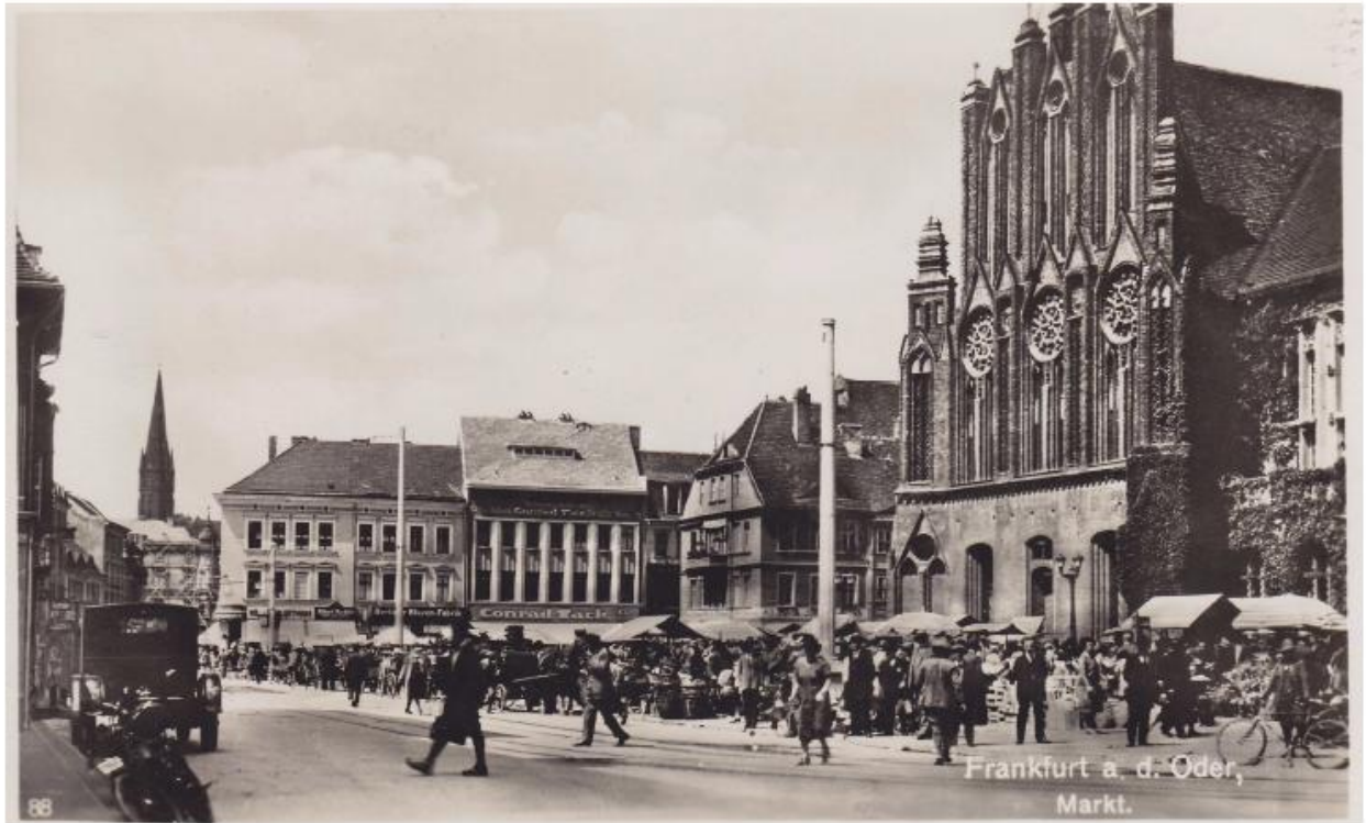
Große Scharnstraße 50 - rechte Seite 2. Haus - Aufnahme von 1930 - Bildarchiv B. Klemm Frankfurt (Oder)