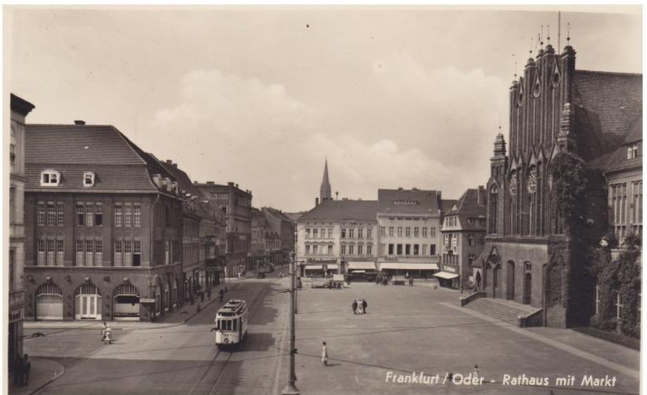
Große Scharnstraße 50 - rechte Seite 2. Haus - Aufnahme um 1936/1938 (örtliche Staatspolizeistelle Frankfurt (Oder) mit Sitz in der Judenstr.17 - linke Seite)