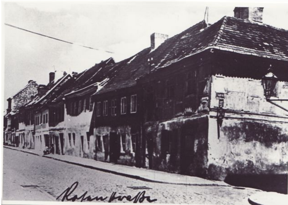
Rosenstraße - Aufnahme von 1915