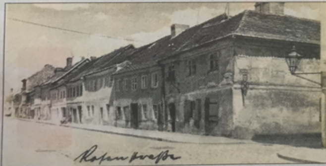
Die Rosenstraße im Jahr 1934

Die Häuser an der Rosenstraße mit insgesamt 120 Wohnungen habe man später jedoch nicht mehr sanieren sondern abreißen wollen. Wie es hieß, seien sie „ausnahmslos ungesund und für den Aufenthalt von Menschen ungeeignet“. Stehen blieben die alten, teils baufälligen Häuser letztlich zunächst dennoch. In der Rosenstraße befand sich damals auch das Hospital der jüdischen Gemeinde, in dem nach dem „Gesetz über die Mietverhältnisse mit Juden“ von 1939/1940 viele Frankfurter, die aus ihren Wohnungen geworfen wurden, notdürftig unterkamen.