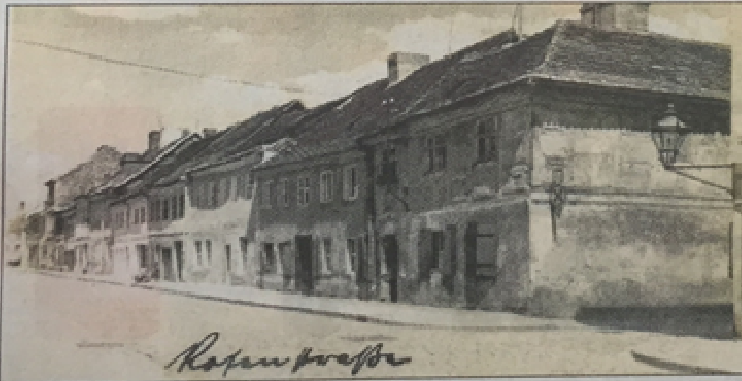
Die Rosenstraße im Jahr 1934

Die Häuser an der Rosenstraße mit insgesamt 120 Wohnungen habe man später jedoch nicht mehr sanieren sondern abreißen wollen. Wie es hieß, seien sie „ausnahmslos ungesund und für den Aufenthalt von Menschen ungeeignet“. Stehen blieben die alten, teils baufälligen Häuser letztlich zunächst dennoch. In der Rosenstraße befand sich damals auch das Hospital der jüdischen Gemeinde, in dem nach dem „Gesetz über die Mietverhältnisse mit Juden“ von 1939/1940 viele Frankfurter, die aus ihren Wohnungen geworfen wurden, notdürftig unterkamen.