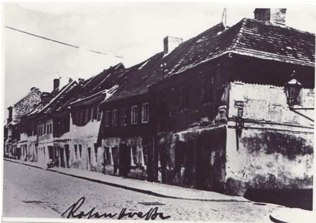
Rosenstraße - Aufnahme von 1915